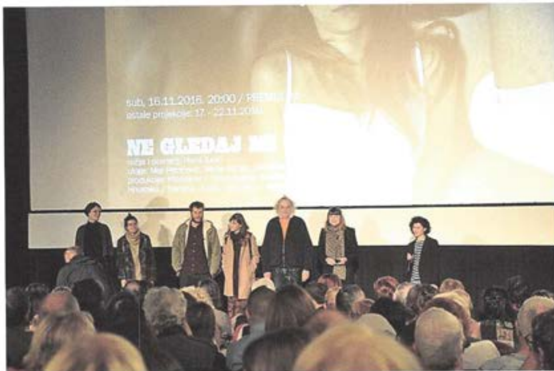
Slika 9. Premijera filma "Ne gledaj mi u pijat" uz gostujuću filmsku ekipu