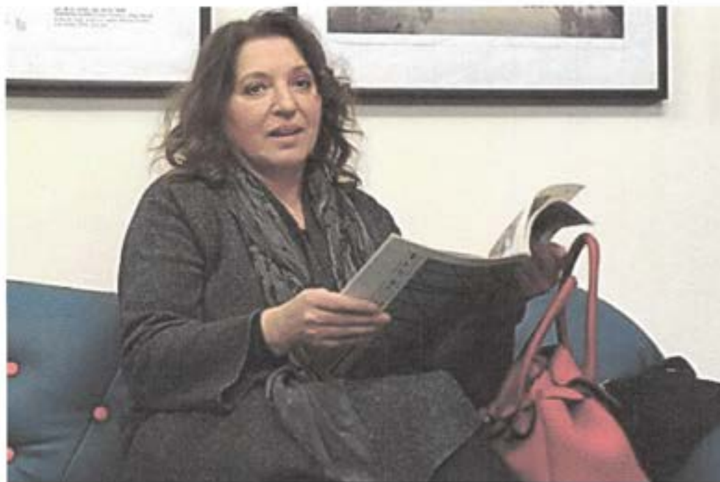
Slika 10. Redateljica i glumica Mirjana Karanović gostovala je u Art-kinu povodom premijere filma "Dobra žena"

U srijedu, 14. prosinca održana je premijera drame „Dobra žena“ uz gostovanje redateljice i glavne glumice Mirjane Karanović.