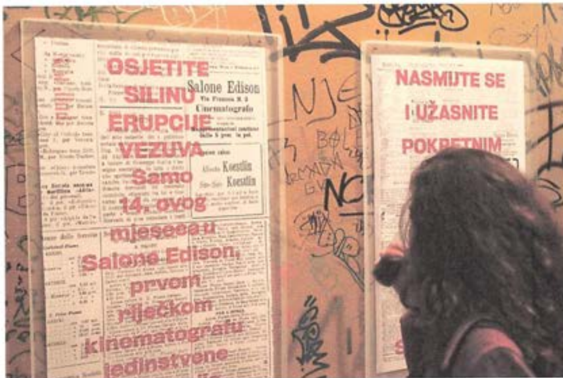
Slika 1. Izložba povodom programa Kino koraci: Salone Edison - obilježavanja 110. godišnjice otvaranja prvog stalnog kinematografa u Rijeci

Povodom obilježavanja 110. godišnjice otvaranja prvog stalnog kinematografa u Rijeci – Salone Edison koji je sa svojim radom započeo prije točno 110 godina u srijedu, 13. travnja otvorena je prigodna privremena izložba u hodniku kuće "Adamić" čiji su autori Damir Gamulin i Antun Sevšek. U Ulici Pavla Rittera Vitezovića, iza "Palače Adamić" prikazani su filmski zapisi Rijeke. Riječku povijest gledali smo u filmovima poput "Porinučić broda Sv. Stjepana" u brodogradilištu iz 1914. godine pronađenog u mađarskom digitalnom arhivu. Program je proveden u suradnji s Muzejom Grada Rijeke.