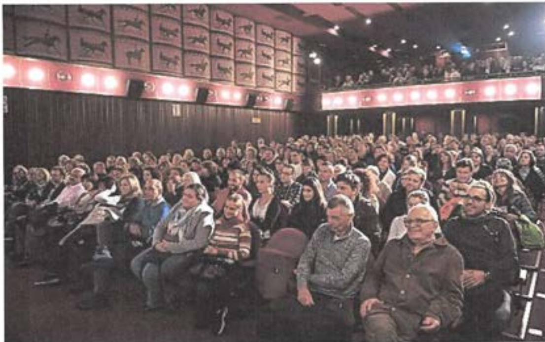
Slika 8. Premijera filma "Gazda" bila je rasprodana

U suorganizaciji Studentskog kulturnog centra (SKC) i riječke udruge Filmaktiv, održan je Međunarodni studentski filmski festival - STIFF pod motom Rethinking reality / Promišljajući stvarnost . Prikazano je 47 autorskih radova od kojih 20 igranih, 16 dokumentarnih i 11 animiranih filmova. Ovo je treće izdanje ovog međunarodnog studentskog festivala koji Art-kino ugošćuje od samog početka.