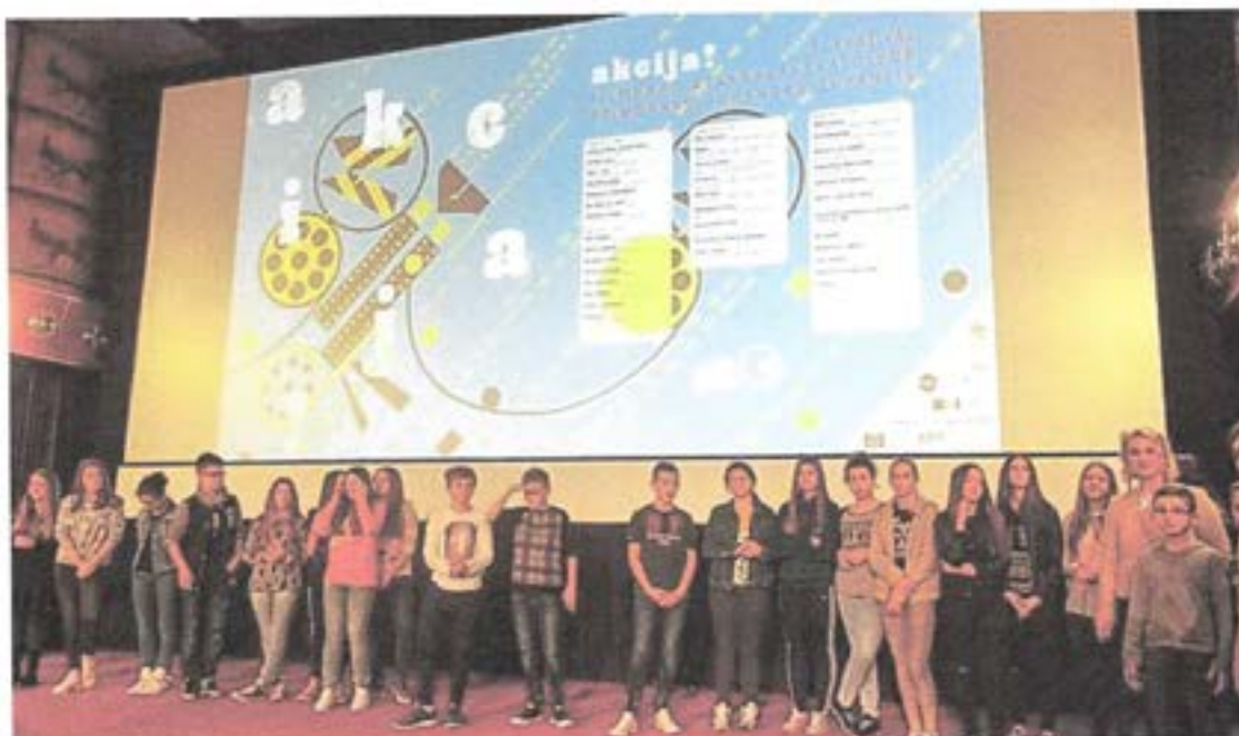
Slika 13. AKCIJA! Festival filmskog stvaralaštva djece Primorsko - goranske županije

Pored svega navedenog valja na kraju spomenuti i program suradnje sa srednjom školom na talijanskom jeziku iz Rijeke u okviru kojeg su, u travnju, u suradnji s Talijanskom unijom iz Trsta, organizirane projekcije talijanskih igranih filmova „Il giovane favoloso“ i „Bianca come il latte, rossa come il sangue“. Navedeni program ima za cilj popularizaciju talijanskog filma među mlađim naraštajima riječkih srednjoškolaca. Također valja spomenuti i program organiziran u suradnji s Nastavnim zavodom za javno zdravstvo Primorsko-goranske županije za potrebe programa Zavoda - „Trening životnih vještina“ u okviru kojeg je prikazan australski igrani film za djecu „Oddball“. Konačno valja spomenuti i posebne programe koji su organizirani u suradnji s ustanovama i udrugama koje brinu o djeci, a koja su socijalno ugrožena ili imaju drugih poteškoća.