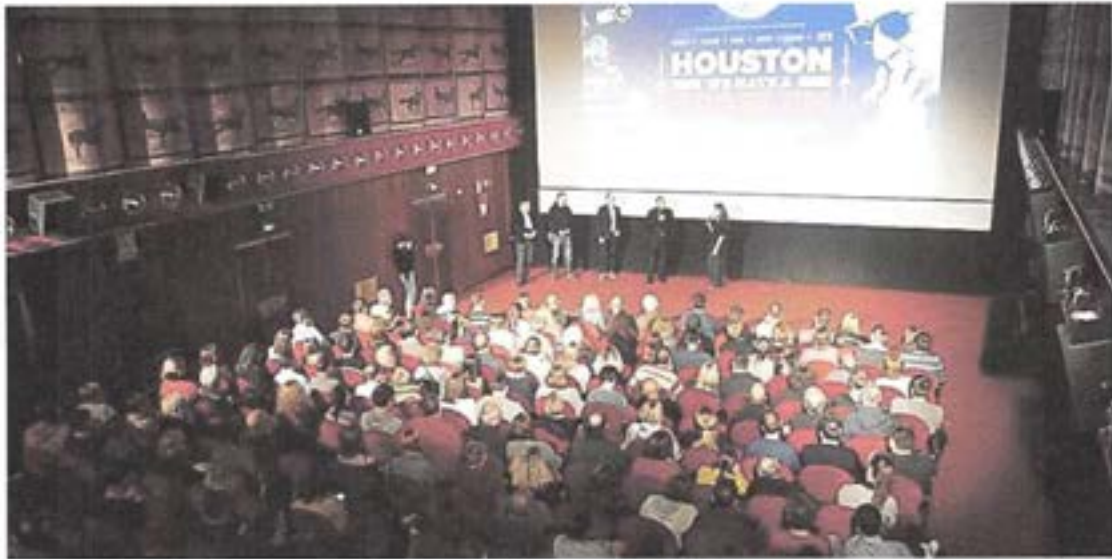
Slika 2. Premijera dokumentarno - igranog filma "Houston, imamo problem" uz brojnu publiku i goste

Film je nastavio redovno prikazivanje u Art-kinu, a premijerno je prikazivanje rasprodano.